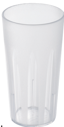
TR-807N キングタンブラー 500ml (ナチュラル) ¥590