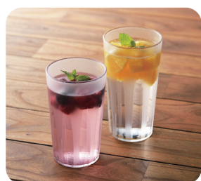
No.806N No.807N (ナチュラル)

No.806 キングタンブラー 410ml ¥560 80φ×128mm 410ml PCT樹脂(トライタン) 耐熱温度120度