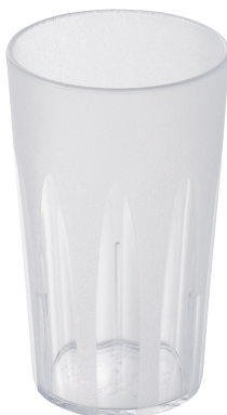
TR-806N キングタンブラー 410ml (ナチュラル) ¥560