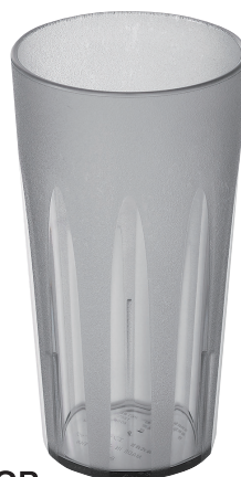
TR-807GR キングタンブラー 500ml (グレー) ¥590