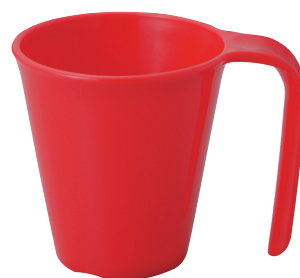
No.1732 スマイルカップ 250ml (レッド) ¥170