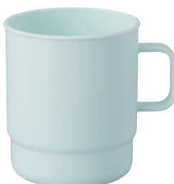
No.810 ピクニックコップ (パステルブルー) ¥160