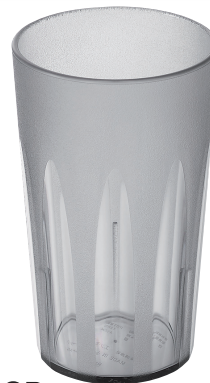
TR-806GR キングタンブラー 410ml (グレー) ¥560