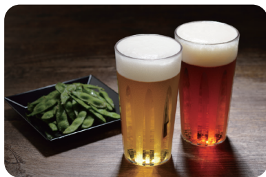
クリスタルで割れにくいタンブラー