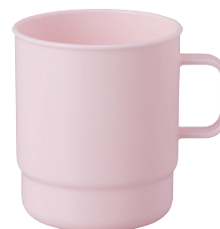
No.810 ピクニックコップ (パステルピンク) ¥160