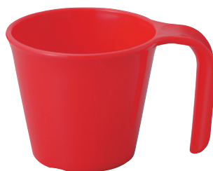
No.1731 スマイルカップ 230ml (レッド) ¥160