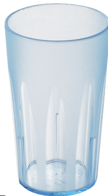
TR-806B キングタンブラー 410ml (ブルー) ¥560