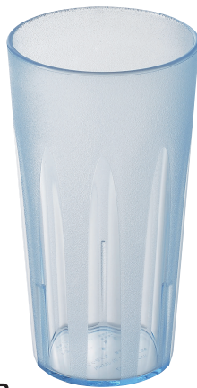
TR-807B キングタンブラー 500ml (ブルー) ¥590