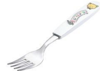
L-107 フォーク 上代¥210.-