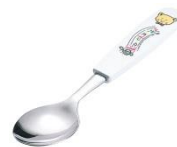
L-106 スプーン 上代¥210.-