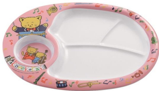
L-102 お子様ランチ皿 ピンク 上代¥1800.-