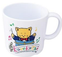
L-115B 片手コップ (大)