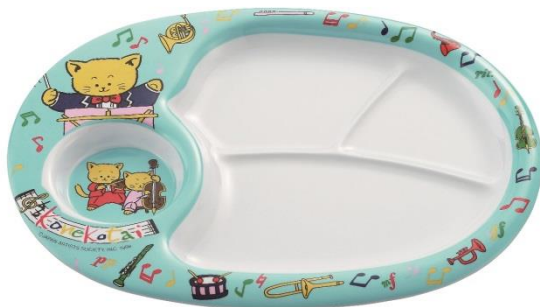
L-101 お子様ランチ皿 ブルー 上代¥1800.-